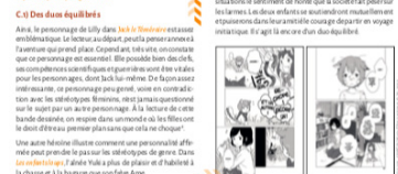
Une autre héroïne (Iliade) comment une personnalité affirmée peut prendre le pas sur les stéréotypes de genre. Dans les aventures de l'Amazone, plus de plaisir et d'habileté à la chasse et à la bagarre que son frère Arce.

Il s'agit de comprendre pourquoi et comment des assignations genrées (masculin et féminin) sont données aux personnages dans une bande dessinée. Les personnages sont masculins ou féminins, mais ils ne sont pas forcément tels qu'on les imagine. Par exemple, un personnage masculin peut être une jeune fille ou un garçon, et un personnage féminin peut être un homme ou une femme. On va donc chercher à déconstruire ces stéréotypes de genre.